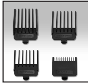
Combs and Hair Length Adjustments